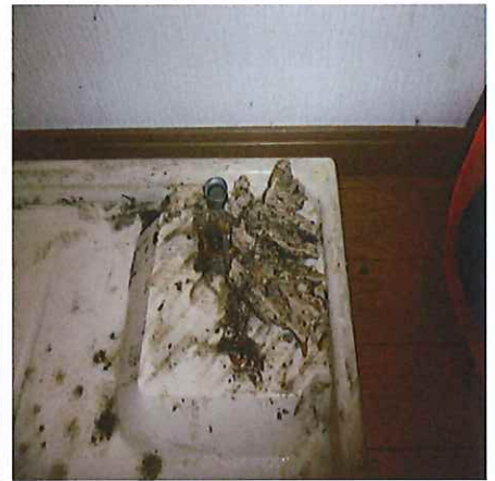
詰りの原因(油の塊)

生活排水(キッチン・浴室・洗面・洗濯場等)から出る油・石鹸・髪の毛が固まり排水管に付着していき日に日に水が通りにくくなったり排水口に物を落としたのが原因で後々詰まってしまうというのが多々あります。