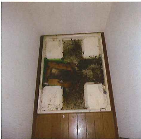
洗濯パン 排水逆流状況

排水の流れが悪く感じる、水が流れる時にコポコポという、汚水等が逆流してきた時などは、排水管の汚れによる詰りの原因が考えられます。